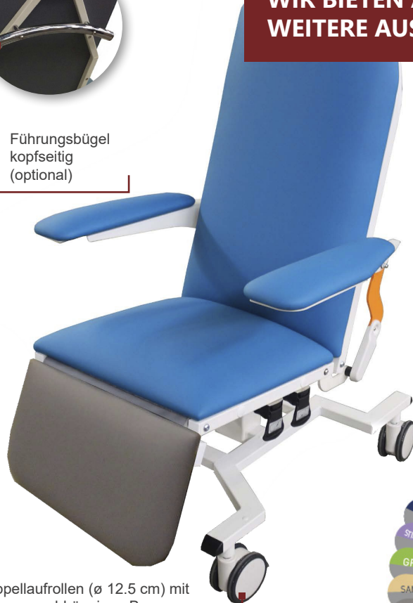
Doppelaufrollen (ø 12.5 cm) mit unabhängigen Bremsen

WIR BIETEN AUF ANFRAGE WEITERE AUSFÜHRUNEN AN!